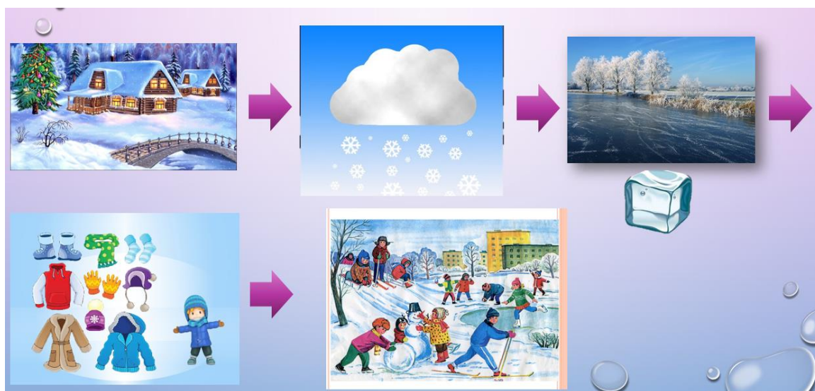
Рис. 3 – Мнемо-таблица по теме «Зима»

Мнемотаблицы – это схемы, состоящие из последовательно расположенных изображений-символов, в которых зашифровано содержание текстов (сказки, стихотворения и так далее). Благодаря ним ребенок может воспринимать информацию не только на слух, но и при помощи зрительных образов.