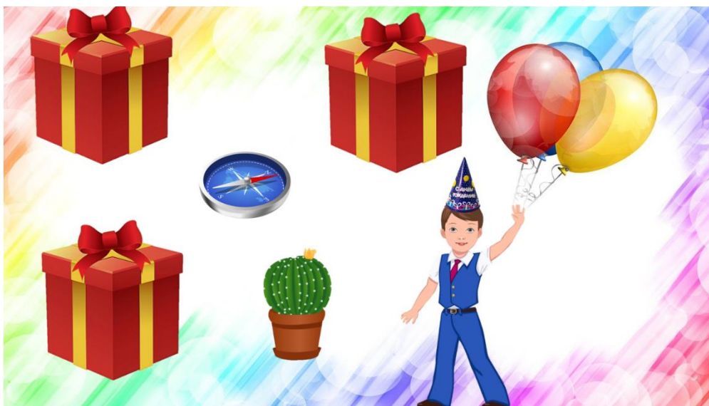
Рис. 2- Скриншот слайда из презентации

Материал: чайник, сундук, кактус, компас, коврик.